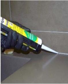
Figure 1. Application mastic

Dans le monde de la construction et de la rénovation des bâtiments, le collage est une méthode à la fois universelle car appliquée à une grande diversité de matériaux et structures, et à la fois complexe car elle met en jeu chimie des polymères, propriétés des interfaces et mécanique de la rupture. Les adhésifs ou mastics utilisés dans la construction présentent en effet une grande diversité de chimies et de formulations : silicones, acryliques, polyuréthanes, polymères hybrides. Les substrats à coller peuvent être en métal, en ciment, en céramique, en bois. Le comportement mécanique de ces mastics et adhésifs diffère fortement de ceux généralement utilisés pour la réalisation d'assemblages structuraux pour lesquels est demandé une grande reproductibilité de comportement une rigidité et une résistance mécanique importante. En effet, silicone, polyuréthane etc... sont des matériaux présentant un fort allongement à rupture, un comportement fortement non linéaire mais comme nombre d'élastomères se révèlent